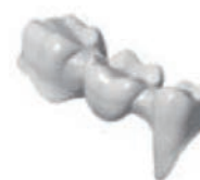
Ponte corona interna