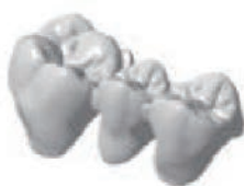
Ponte corona completa